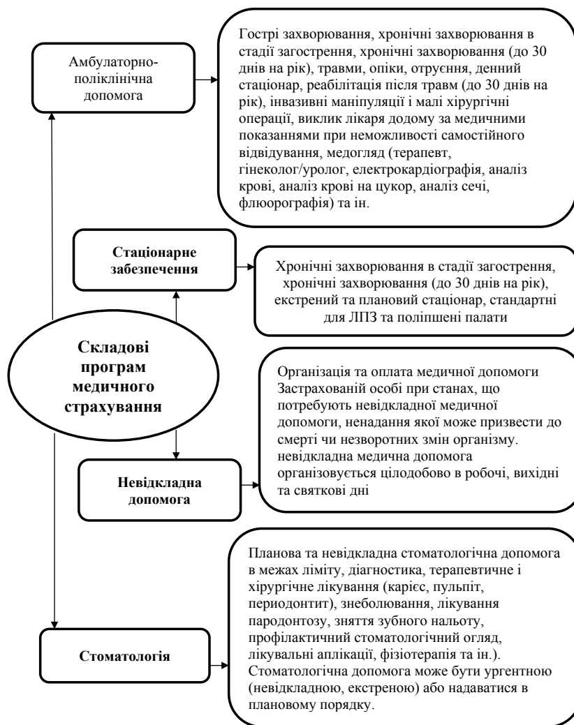
Рис. 2. Основні складові програм медичного страхування