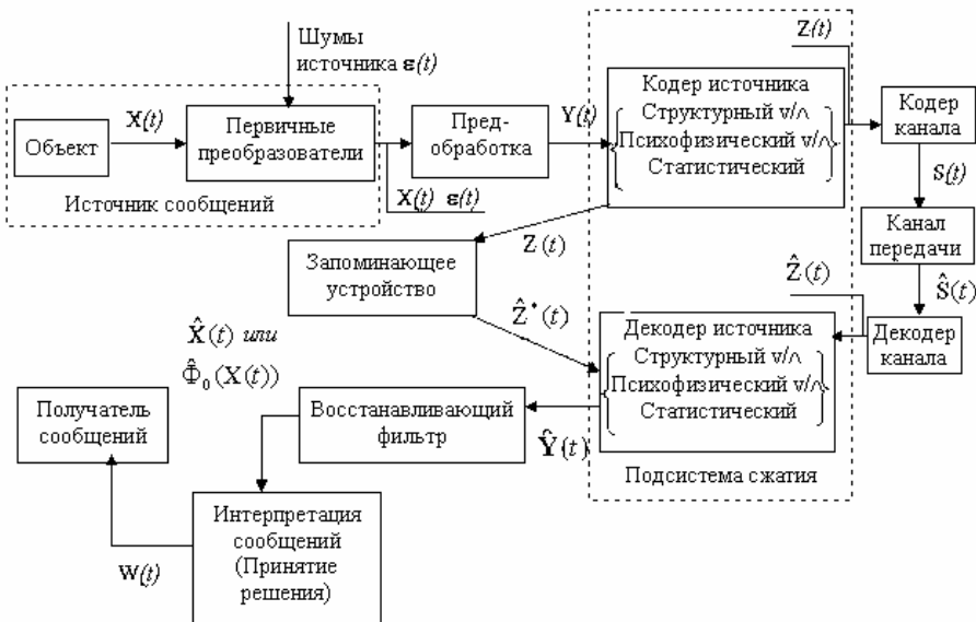
Рис. 1. Обобщенная модель информационных технологий со сжатием данных

с физическими и психофизическими свойствами получателя, семантическими и прагматическими аспектами восприятия информации. Процесс разработки методов сокращения такого вида избыточности трудно формализуем и носит в значительной степени эвристический характер.