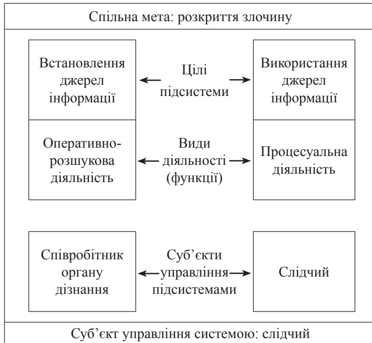
Схема 2.2. Організація взаємодії слідчого з органами дізнання (системний підхід)

Інакше виглядає схема організації взаємодії слідчого з органами дізнання при системному підході, відповідно до якого повинні бути показані функції управління і його суб'єкти, визначена не тільки спільна мета діяльності людей (у цьому разі слідчого та співробітників органу дізнання), але й ті конкретні завдання, які кожен із них визначає для себе (схема 2.2.).