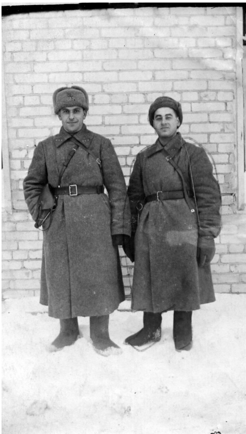
1941 р. Військові будні