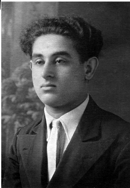
1938 р. Аспірантура