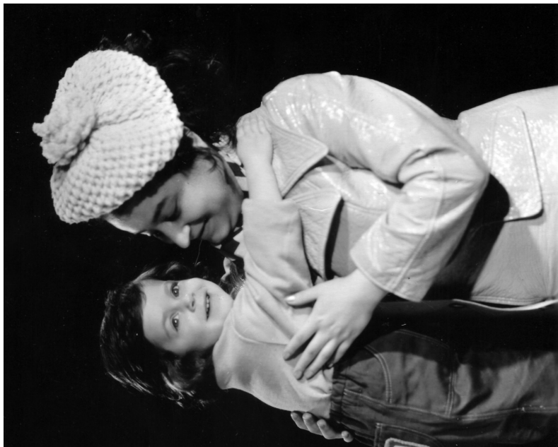
Молодша донька Тетяна з донькою Ольгою