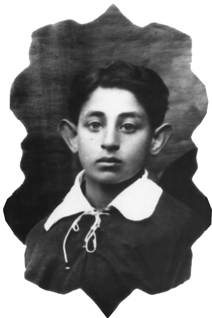
1926–1927 рр. Школяр-футболіст