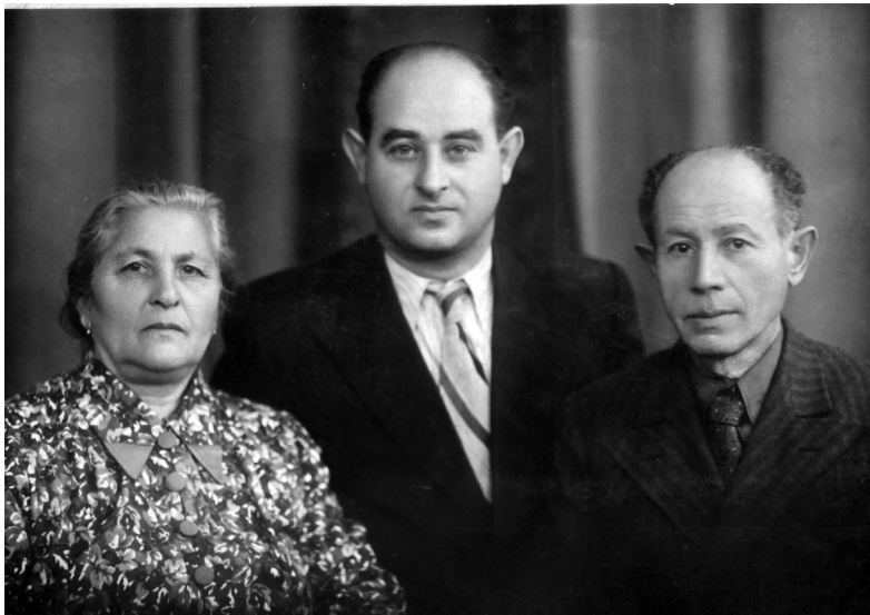
Повоєнні роки. З батьками