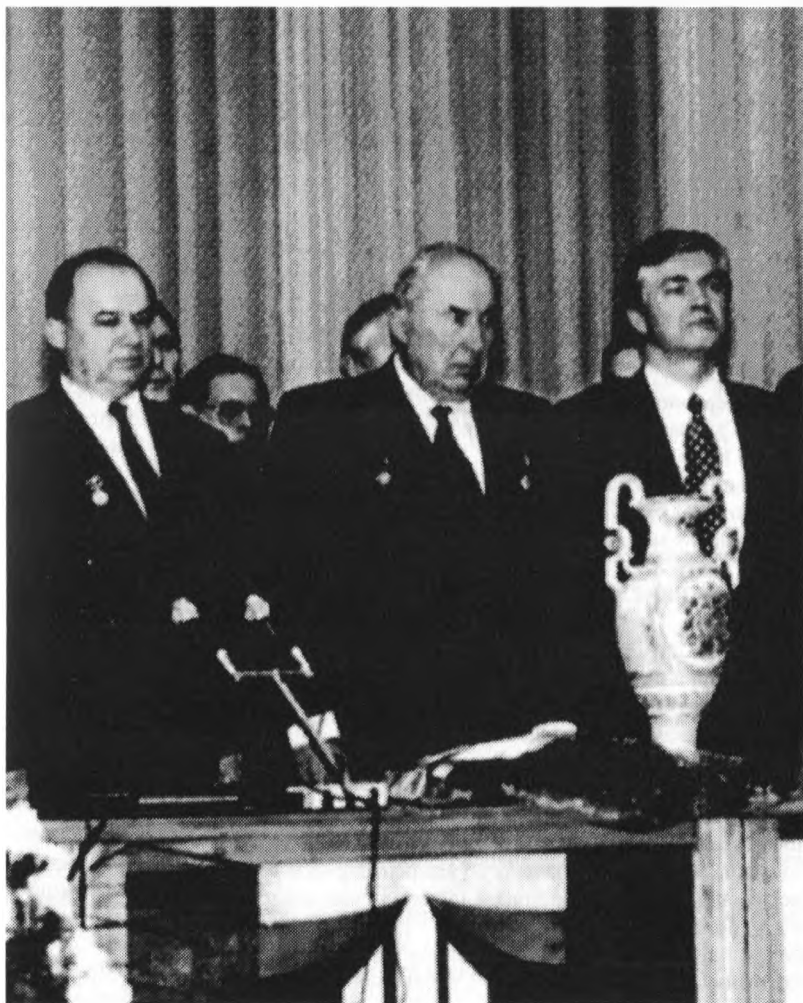
Святкування Дня Академії

удостоїла В. В. Сташиса Всесвітнього ордену науки-освіти-культури. На його честь Міжнародний Астрономічний Союз у 2000 році присвоїв ім'я Stashis планеті №7373, що була відкрита вченими Кримської астрофізичної обсерваторії.