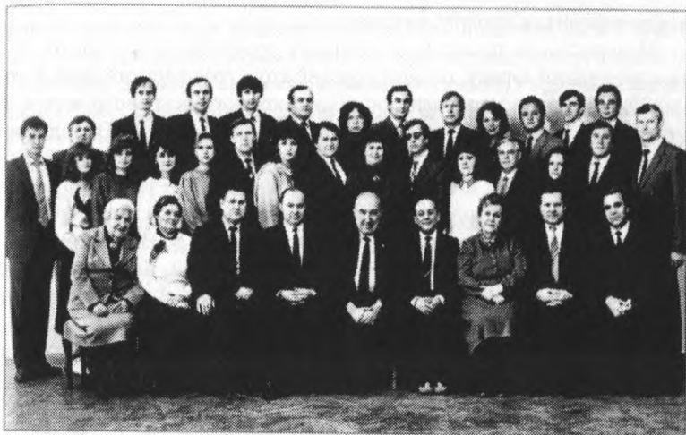
Колектив кафедри кримінального права, 1991 р.

ються нові сучасні технології: програмоване навчання, комп'ютерна техніка; викладачі постійно підвищують свою професійну кваліфікацію; студенти долучаються до новітніх досягнень юридичної науки тощо.