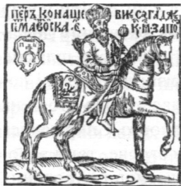
П. К. Конашевич-Сагайдачний. Гравюра з книги Касіяна Саковича «Вірші на жалосний погреб...». 1622.

Справжнє прізвище – Конашевич. С. – це прізвисько, що походить від слова «сагайдак» – шкіряна торба або дерев'яний футляр для стріл, а також лук. С. Петра Конашевича назвали за винятково майстерну стрільбу з лука. Навіть на єдиному його портреті, виконаному сучасником, він зображений із сагайдаком за спиною.