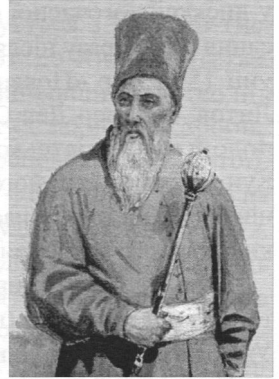
П. К. Сагайдачний. Портрет невідомого автора. 19 см.

Закінчивши навчання, С. переїхав із Острога до Києва і почав працювати домашнім учителем у міськ. судді Яна Аксака. Свідченням певного соц. статусу С., який давав йому право брати участь