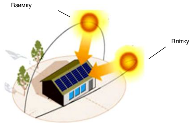
Рис. 1. Освітленість фотоелектричного модулю, встановленого на даху будівлі в різну пору року