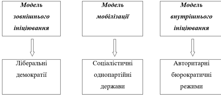
Рис. 1. Кореляція основних моделей встановлення порядку денного з політичними режимами (концепція Р. Коба, Дж. Роса та М. Роса) 1

Модель мобілізації, будучи притаманною тоталітарним режимам, описує прагнення відповідальних за прийняття політичних рішень розширити проблемні питання, що належать до інституційного (формального) порядку денного, до такої міри, щоб вони заповнили собою системний (публічний) порядок денний. Проблемні питання з'являються в інституційному порядку денному без попереднього їхнього висвітлення у системному (публічному). Отже, у цьому випадку зв'язок з громадськістю спрямований на мобілізацію суспільної підтримки владних рішень («зверху вниз»). Відповідно, «рух» проблемних питань спрямований від інституційного до системного порядку денного.