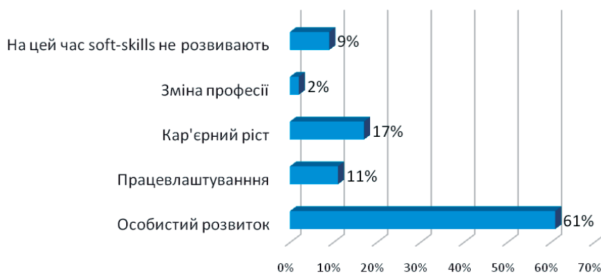
Рис. 3. Причини, через які опитані студенти розвивають «soft-skills»

Основною причиною, через яку респонденти розвивають свої «soft skills» було вказано особистий розвиток (61% опитаних). Для 17% це просування по кар'єрних сходинках і для 11% працевлаштування (рис. 3).