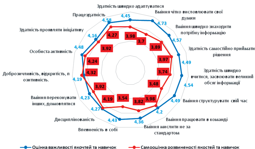
Рис. 1. Порівняння оцінок важливості якостей та навичок із самооцінкою їх розвиненості у опитаних (надано у вигляді середнього балу за п'ятибальною шкалою від 1 (не важливо) до 5 (дуже важливо))

Респонденти порівняно високо оцінюють такі свої якості як доброзичливість, відкритість, позитивність, працездатність, особиста активність, дисциплінованість, здатність швидко адаптуватися, самостійно приймати рішення (рис. 1).