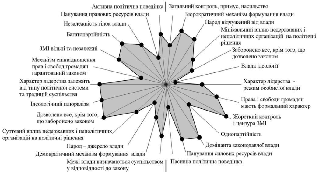
Рис. 1. Векторна модель політичних відносин (Україна, 2018 р.)

Висновки. Політичні відносини формують ядро будь-якої соціальної системи, врегульовують й врівноважують доцентрові і відцентрові сили, що забезпечують її цілісність та сталий розвиток. Дослідження цих відносин виключно політологами штучно звужує проблему. Соціологічний аналіз дозволяє розкрити їхні статичні і динамічні характеристики, оскільки на основі дослідження політичних ситуацій (соціальна статика) визначає політичні сюжети й прогнозує політичні зміни (соціальна динаміка). Поєднання статичного та динамічного принципів аналізу можна порівняти з процесом створення відеоролика. Кожний окремих кадр характеризує певну соціально-політичну ситуацію, основних акторів та характер й умови їх взаємодії, а послідовність таких кадрів формує повноцінне системне уявлення про «сюжет», динаміку і основні параметри соціально-політичних процесів і відносин в суспільстві. Саме такий підхід було використано нами при розробці векторної моделі соціологічного аналізу політичних відносин.