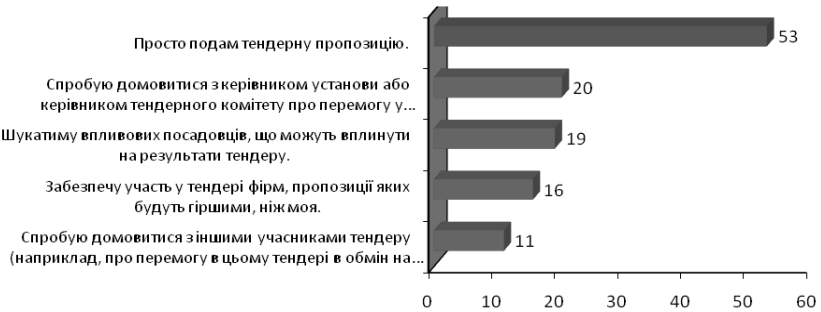
Рис. 1. Дії підприємств для забезпечення перемоги в тендері

Стосовно участі в тендерній процедурі, за даними опитування підприємств, дві третини з опитаних (66 %) готові вдатися до тих чи інших корупційних дій, що забезпечать перемогу в конкурсі (рис.).