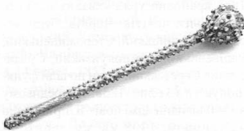
Булава. Поч. 19 ст.

Б. виготовлялася у формі кам'яної (кам'яний вік), а пізніше металевої кулі (бронз. вік) розміром 10–15 см у діаметрі, на державку завдовжки 0,5–0,8 м. Б. поділялися на великі, малі та перначі або шестопери (голівка якого розділена на поздовжні часточки), які носили за поясом полковники. У запороз. отаманів великі Б. робилися зі срібла, а малі – із заліза. Із кін. 16 ст. Б. із королів. рук одержували старші козац. реєстру, а згодом гетьмани Війська Запороз. Б. урочисто вручалася кожному новообраному гетьманові представниками козац. старшини. З істор. джерел відомо, що вже в 1581 запорожці віддають новому гетьманові С. Зборовському до рук Б. зі словами: «Подаємо