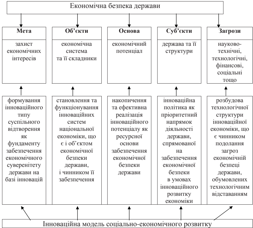
Рис. 4.2. Роль інноваційної моделі соціально-економічного розвитку в забезпеченні економічної безпеки держави

Роль інноваційної моделі соціально-економічного розвитку в забезпеченні національної економічної безпеки відображено на схемі (рис. 4.2).