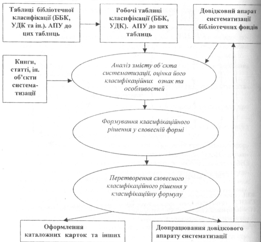
Рис. 3. Типова схема класифікації видання або його складової частини

Із використанням сучасних бібліотечних інформаційних технологій, впровадженням автоматизованих бібліотечних комплексів (АБК), створенням бібліотечних Web-сайтів, електронних каталогів, у яких кожне видання, стаття та інші документи класифіковані не тільки за традиційною системою, але й за іншими важливими аспектами та ознаками, а саме: