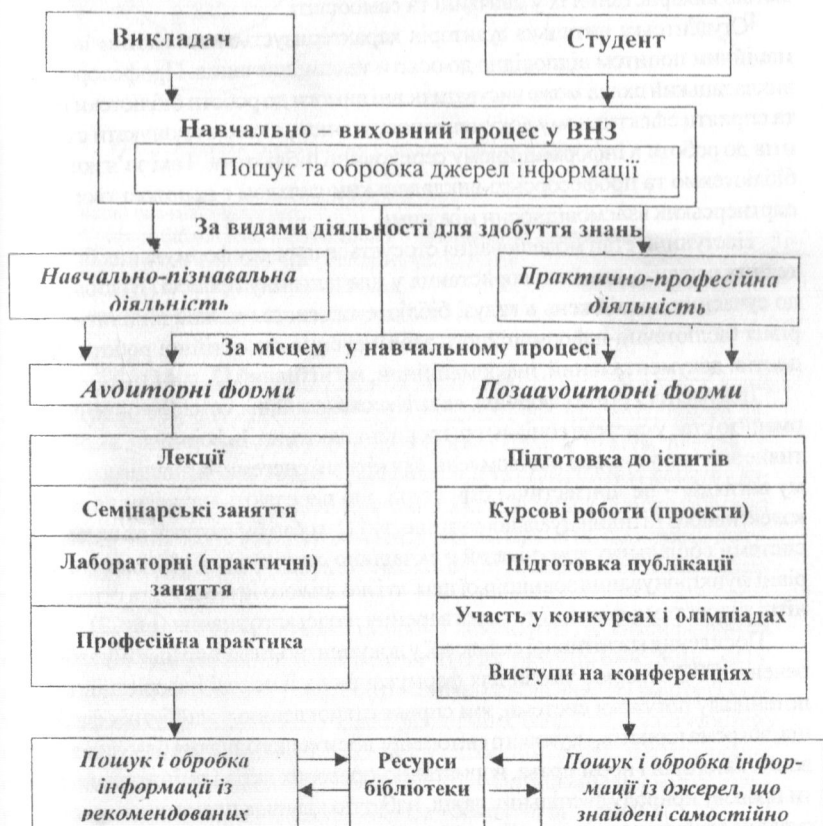
Рис. 1. Схема інформаційного забезпечення навчального процесу

Такий комплексний підхід зумовлений місцем і роллю бібліотеки, викладачів, студентів у структурній організації бібліотечно-інформаційного забезпечення навчально-виховного процесу ВНЗ (рис. 1).